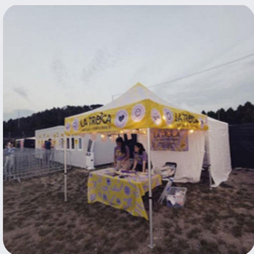
Festival Cabró Rock (Vic) 16 i 17 de juny del 2023