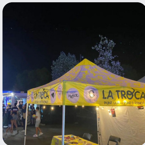
Festa Major de l'Escala 31 d'agost, 1 i 2 de setembre de 2023